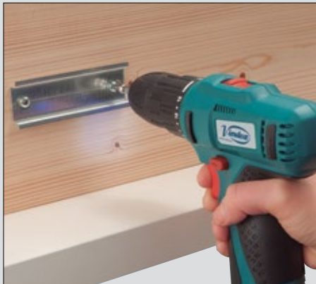
Compacto, potente y de práctico manejo.