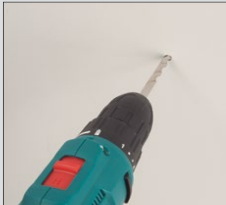
Portabrocas de sujeción rápida.