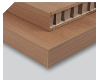
Aplacado de paneles tamborados o "nido de abeja".