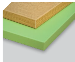
Acabados de gran calidad en múltiples tipos de materiales.

Admite paneles de 13 a 50 mm de grosor . Canteado y acabado de paneles atamborados o "nido de abeja".